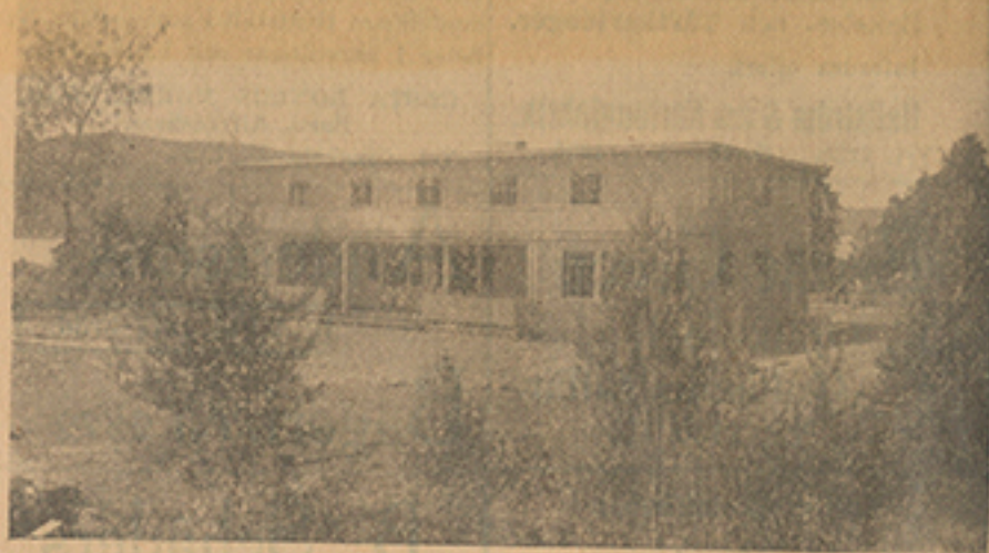
En exteriör av "Storhemmet".

och rum för föreståndarinnor, samt ett par mindre putsrum, o. då byggnaden har formatet 22x11 meter förstår man, att goda utrymmen finnas. En stor veranda bereder barnen tillfälle att i största möjliga mån intaga sina måltider ute i det fria, en "matveranda" alltså. På övre våningen finnas tre rum avsedda för sköterskorna, ett isoleringsrum samt s. k. lekvind, där barnen få leka vid förekommande dålig väderlek e. dyl. Runt hela framsidan på övre våningen går dessutom en balkong, en ypperlig idé, då denna erbjuder goda tillfällen till sol och luft.