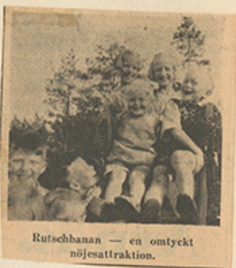
Rutschbanan — en omtyckt nöjesattraktion.