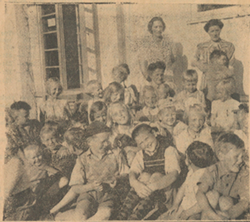
En gruppbild från Solgården i Köpmanholmen.