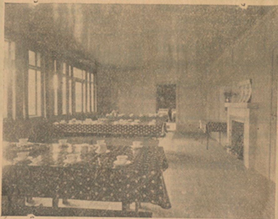
Interiör: den hemtrevliga matsalen.

Stor anslutning väntas till invigningshögtidligheten på midsommardagen.