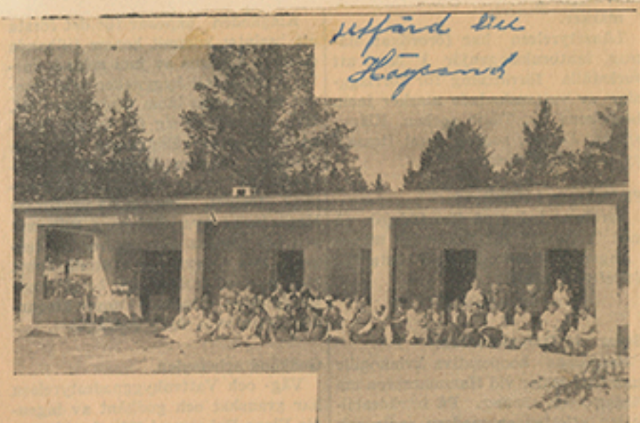
En semesterbild från "Lillhemmet".

Dagen för det remarkabla besöket är som redan antytts icke bestämd, men vi hoppas längre fram kunna återkomma härom.